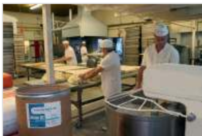
Los panaderos de la cooperativa, en plena producción del pan anticolesterol aprobado por el INAL